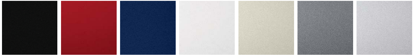
Negro Rojo Azul Blanco Champagne Gris Plata